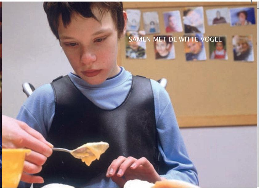
SAMEN MET DE WITTE VOGEL