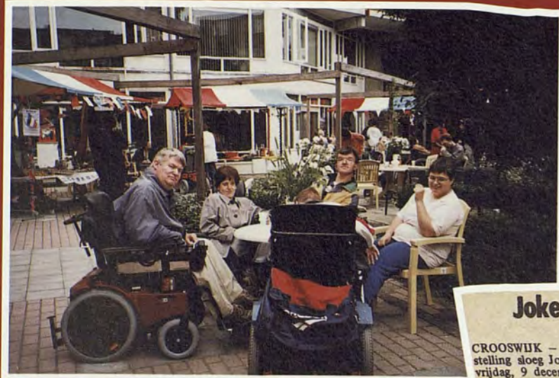
Een feest in Boermarke