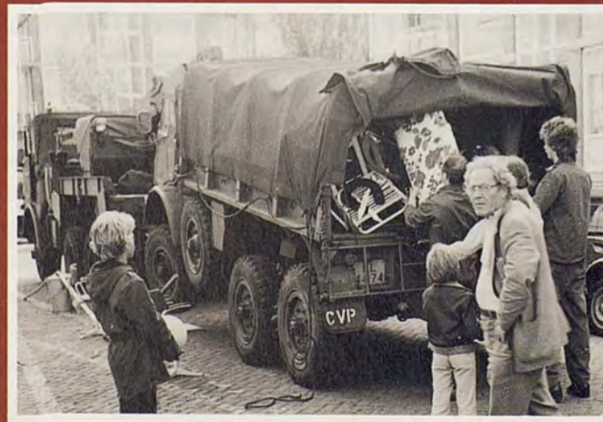
Midden jaren zeventig gaat men vanuit Vredeoord regelmatig op kamp. Legervrachtwagens zorgen voor het vervoer van de materialen. Deelnemers en begeleiders gaan met de bus.