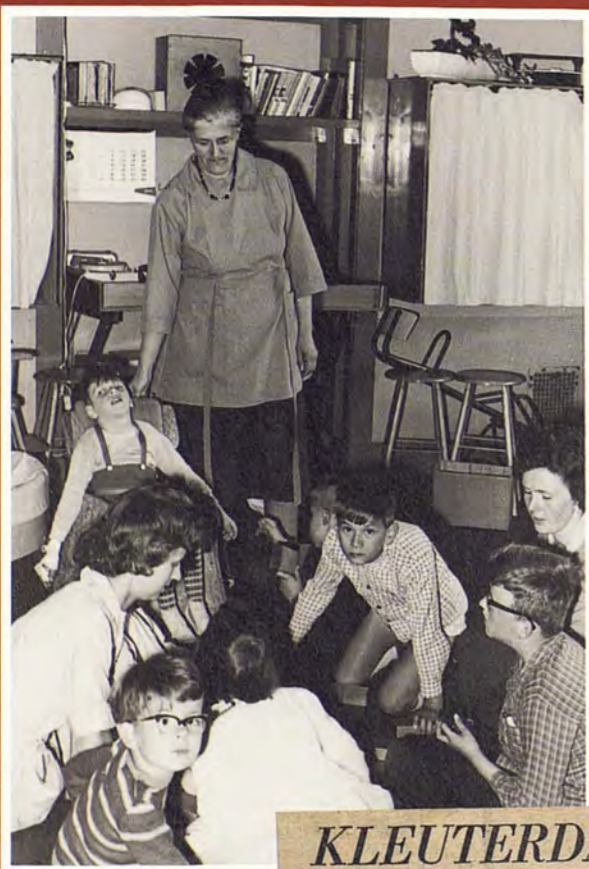
Het klasje van mevrouw Thomassen