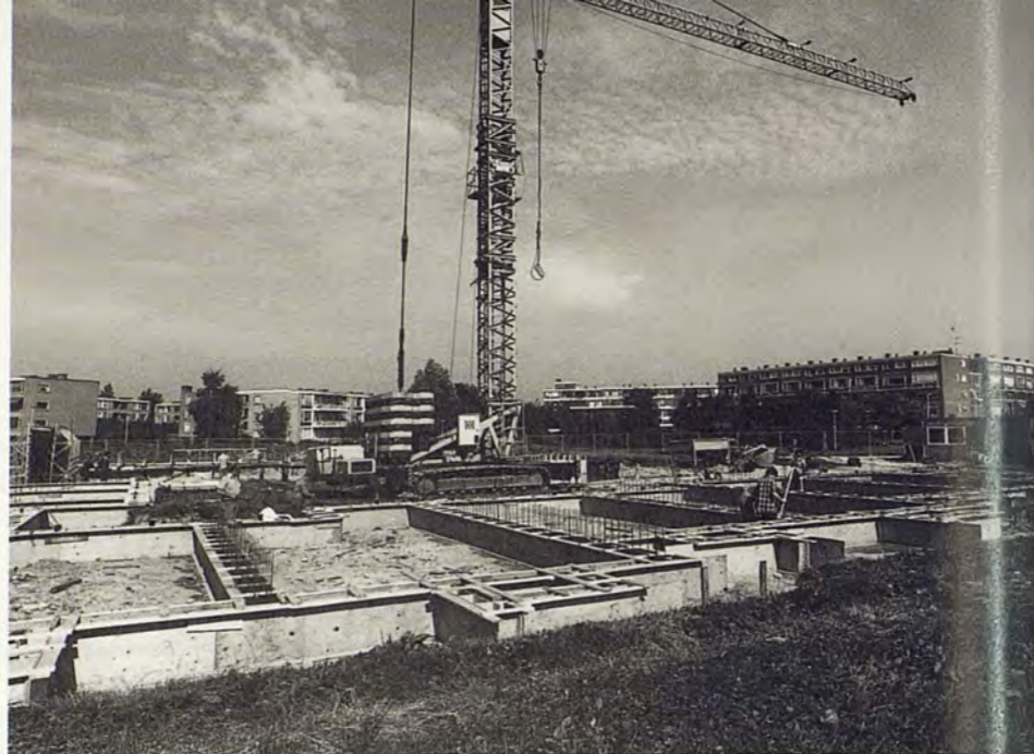
Bouwplaats De Patio

In kindergezinsvervangend tehuis 't Zomerse Hof (in 1972 opgericht) is sprake van hetzelfde uitgangspunt. 't Zomerse Hof ontstaat doordat veel gezinssituaties zwaar onder druk staan door de zorg voor het gehandicapte kind en er in Den Haag geen opvangmogelijkheid is. Het is nauw verweven met het MVC en ook zodanig opgezet dat het contact met het gezin zo veel mogelijk gehandhaafd blijft. Daarom vindt men het ook belangrijk dat het tehuis dicht bij de school staat. Doordat 't Zomerse Hof onderdeel is van het MVC, zijn er veel en intensieve onderlinge contacten. Tegelijkertijd is er wel eens spanning over de ondergeschiktheid van het hoofd van 't Zomerse Hof aan de directeur van het MVC. Een vergelijkbaar dilemma is er over de privacy van de bewoners, doordat het maatschappelijk werk en de orthopedagogische steun in handen zijn van dezelfde personen voor het gehele MVC, dus ook voor 't Zomerse Hof.