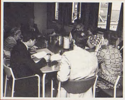
Groot beraad; voorbereiding Lentefeest