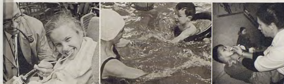
Ieder zijn meug ...