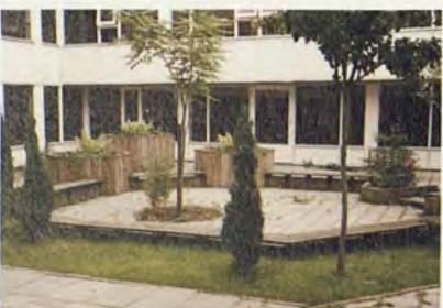
De binnenplaats waar De Patio naar genoemd is