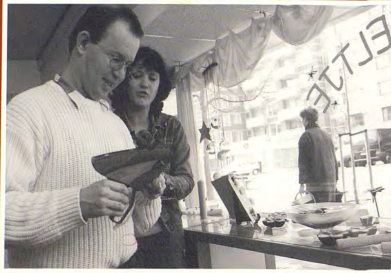
In het winkelcentrum in het Haagse Waldeck opent Twinkeltje haar deuren.