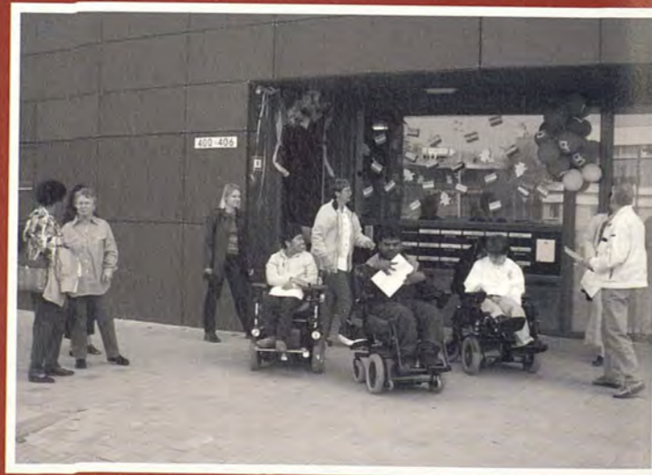
De opening van Zevenkamp