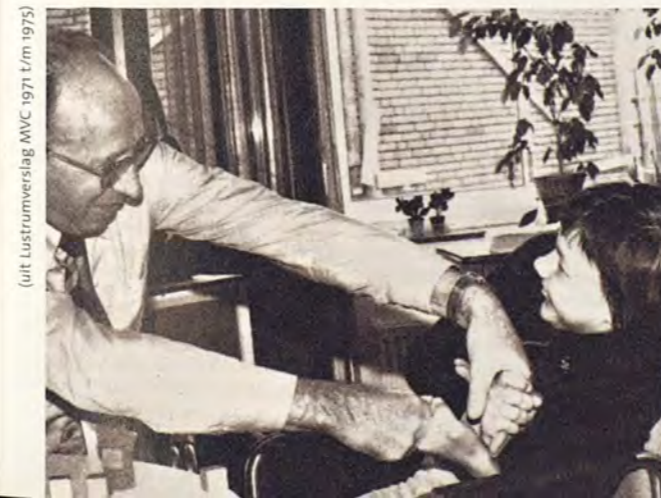
(uit Lustrumverslag MVC 1971 t/m 1975)

Mytylvormingscentrum tot misverstanden leidt; men verwacht bij het woord 'mytyl' geen verstandelijke handicaps. Het woord 'tyltyl' is inmiddels ingeburgerd als alternatief voor 'meervoudig gehandicapt'. Het woord Vormingscentrum, oorspronkelijk gekozen om de verstandelijke handicap aan te duiden, is inmiddels gebruikelijk voor de volwasseneneducatie.