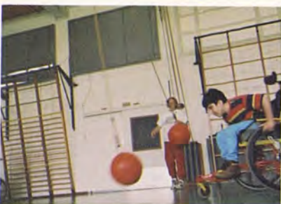
Cliënten in beweging