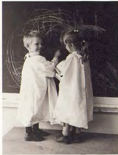
School is fijn.