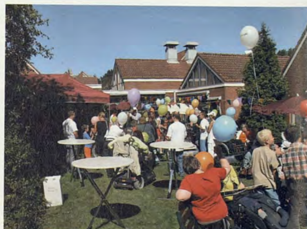
Feest 25 jaar De Vleugel