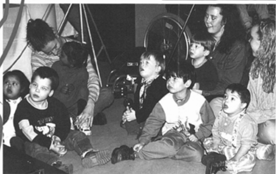
De grote en kleine Joppers hebben genoten.