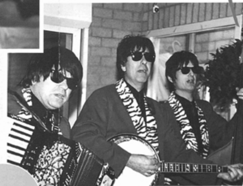
Zie volgende pagina voor meer!