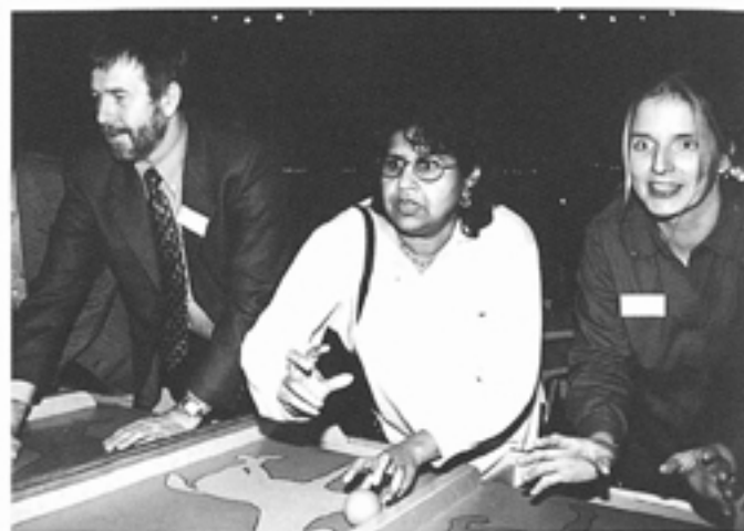
"Het was een geweldig feest met een gezellige sfeer."