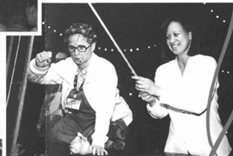
"Het was 's middags erg druk, maar de cliënten hebben erg genoten."

"De cliënten van onze woningen hebben zich uitstekend vermaakt. Dansen, een ijsje halen, een spelletje doen. Het was wel even wachten op de jas en de bus naar huis. Maar de sfeer bleef erin!"